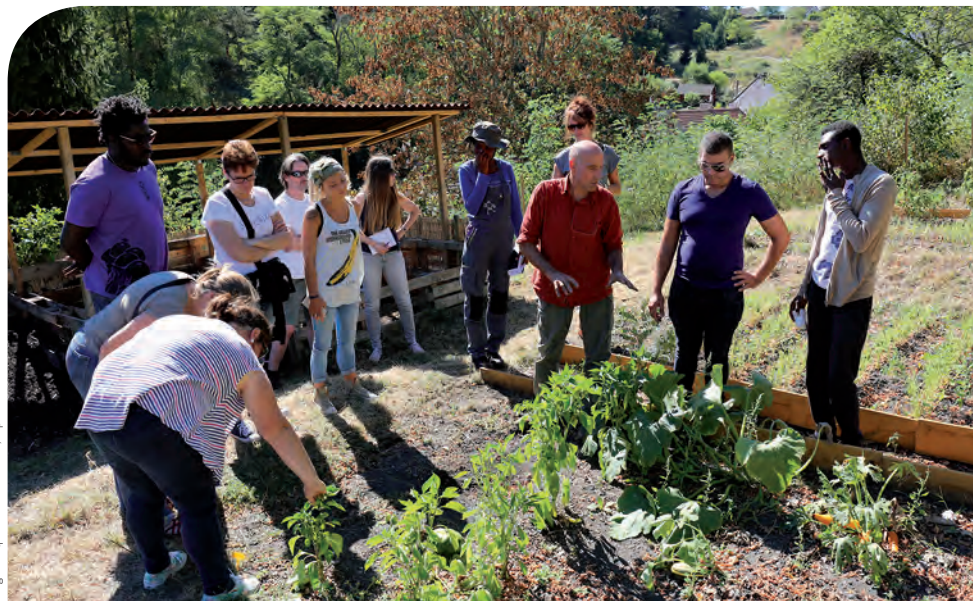
Régie de quartier du Creusot, sept. 2016

Alors que les contrats de ville, génération 2015-2020, arriveront à mi-parcours, cet atelier sera l'occasion de confronter les attentes et ambitions nées de la loi Lamy à la réalité de sa mise en œuvre : quelle plus-value réelle du pilotage intercommunal ? Quelle marge de manœuvre laissée aux conseils citoyens ? Quelles évolutions positives des pratiques professionnelles, de la part de toutes les parties prenantes ? Quelle vision nouvelle du développement économique ?